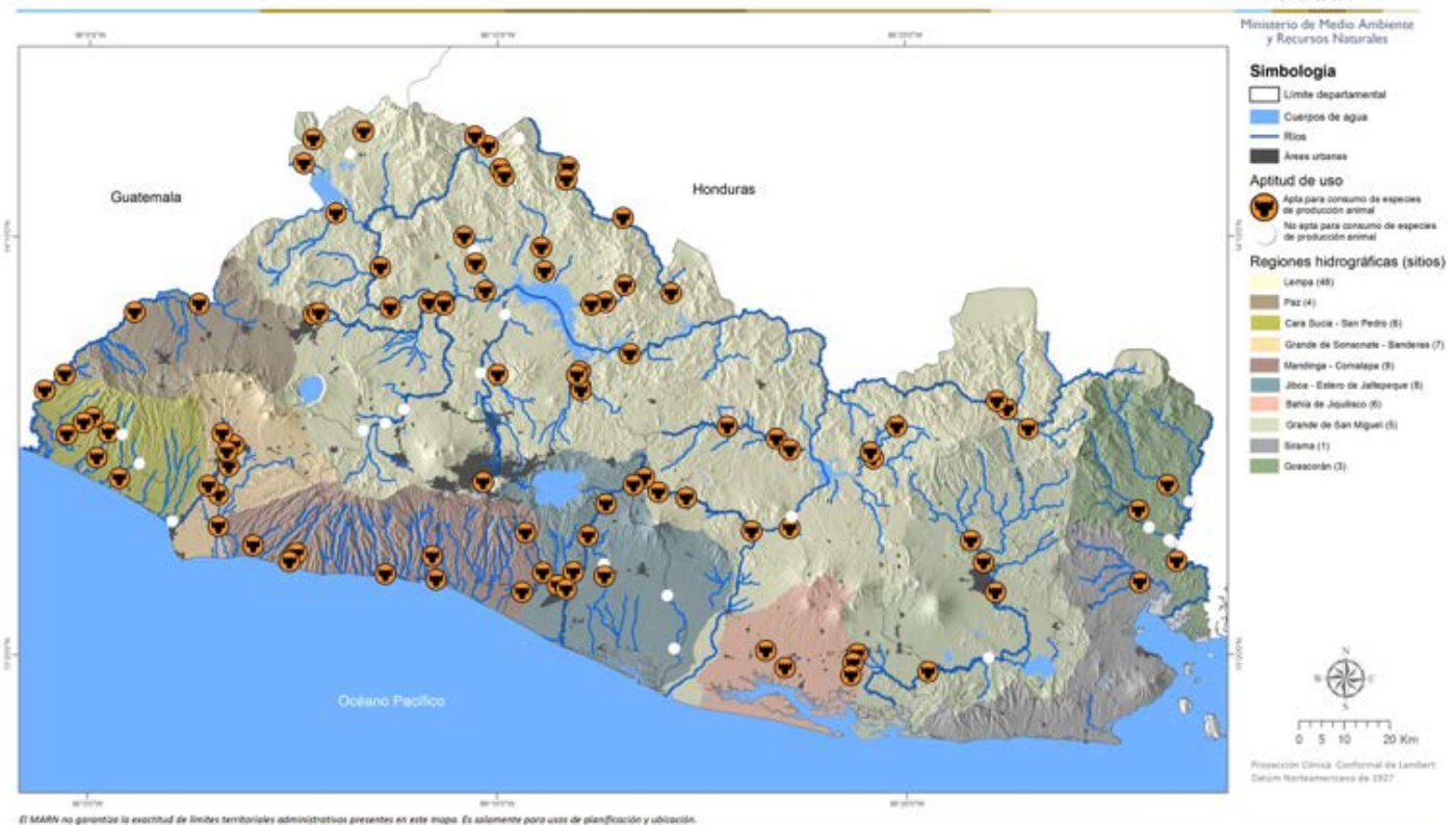
Mapa 8. Resultados de calidad de agua para consumo de especies de producción animal