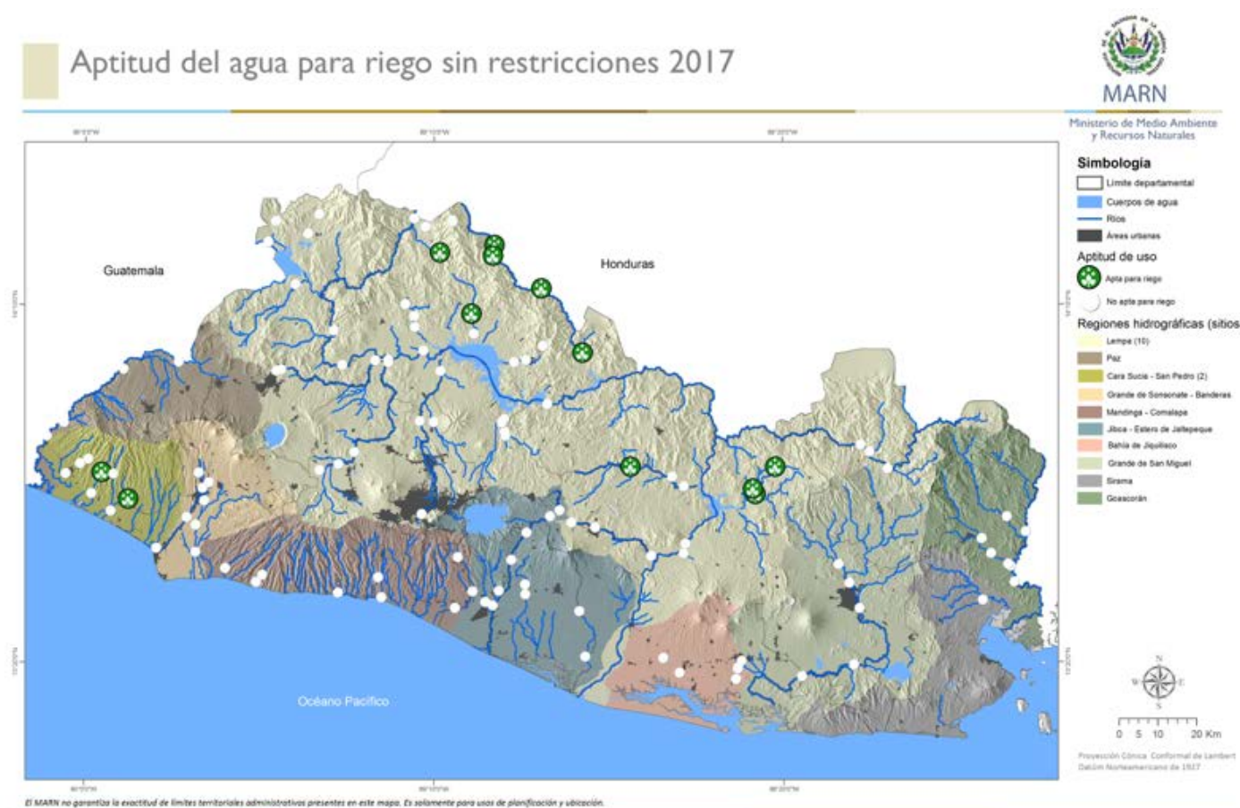
Mapa 7 Resultados de calidad de agua para riego sin restricciones

A continuación se muestra el mapa de los resultados de la calidad de agua para riego sin restricciones.