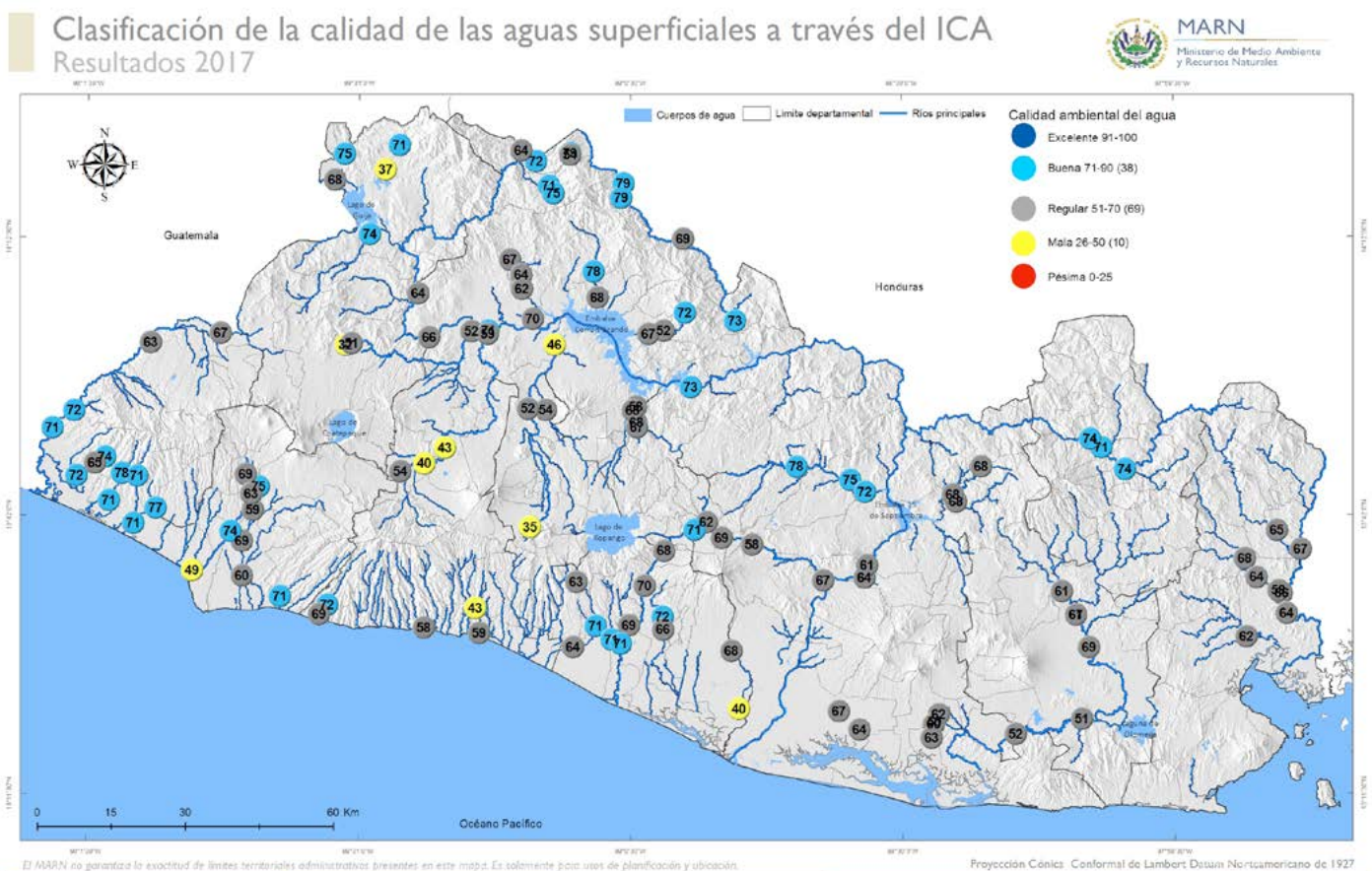
Mapa 2. Calidad de agua valorada a través del Índice de Calidad de Agua (ICA) para el año 2017

A continuación se muestran los resultados de la calidad del agua valorada a través de la aplicación del Índice de Calidad de Agua (ICA)