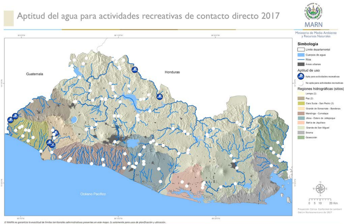
Mapa 9. Resultados de calidad de agua para actividades recreativas de contacto directo

muestran que 96 de los 117 sitios evaluados a escala nacional cuentan con la calidad de agua a ser utilizada para consumo de especies de producción animal, el restante 18 % de los sitios no cumplen debido a estar fuera de los valores de las guías de calidad de agua para los siguientes indicadores: Manganeseo, Aluminio, Cadmio y Conductividad eléctrica.