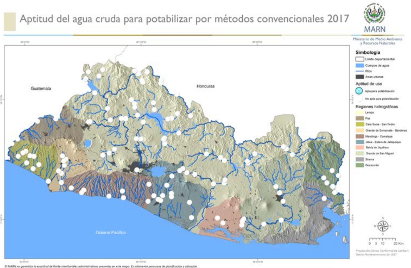
Mapa 6. Resultados de calidad de agua para potabilizar por métodos convencionales

A continuación se muestra el mapa de los resultados de la calidad de agua para potabilizar por métodos convencionales como filtración, cloración, cocción, entre otros.