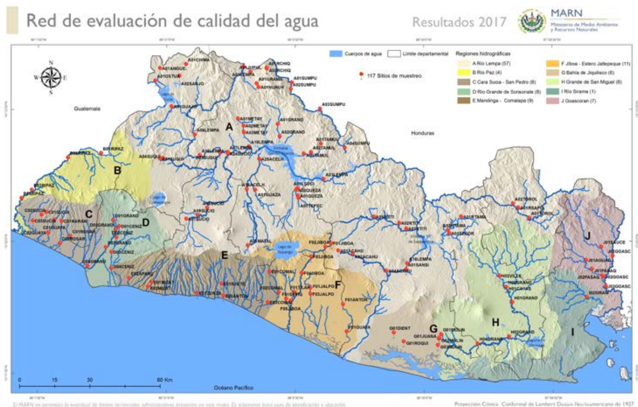
Mapa I. Red de sitios para la evaluación de la calidad de agua de los ríos a nivel nacional.

En el siguiente mapa se presenta los sitios de muestreos de calidad de agua para las 10 regiones hidrográficas del país.